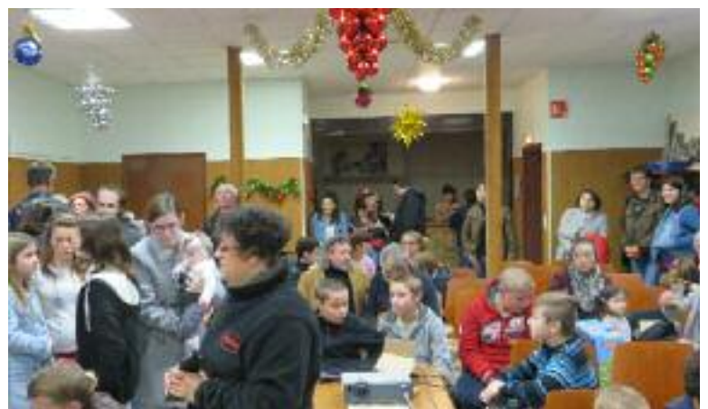
Fête de Noël des enfants