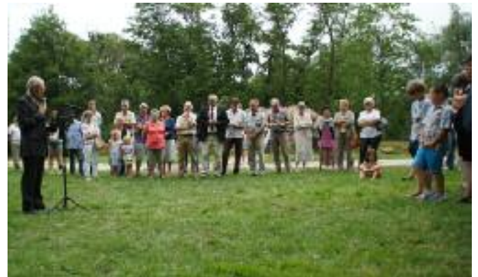
Inauguration du site de l'Ile