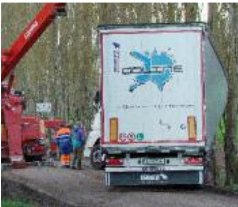
Camion sinistré suite travaux N151