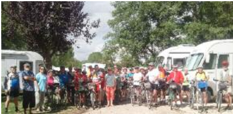
Réunion Club Camping car de l'ouest - Site de l'île