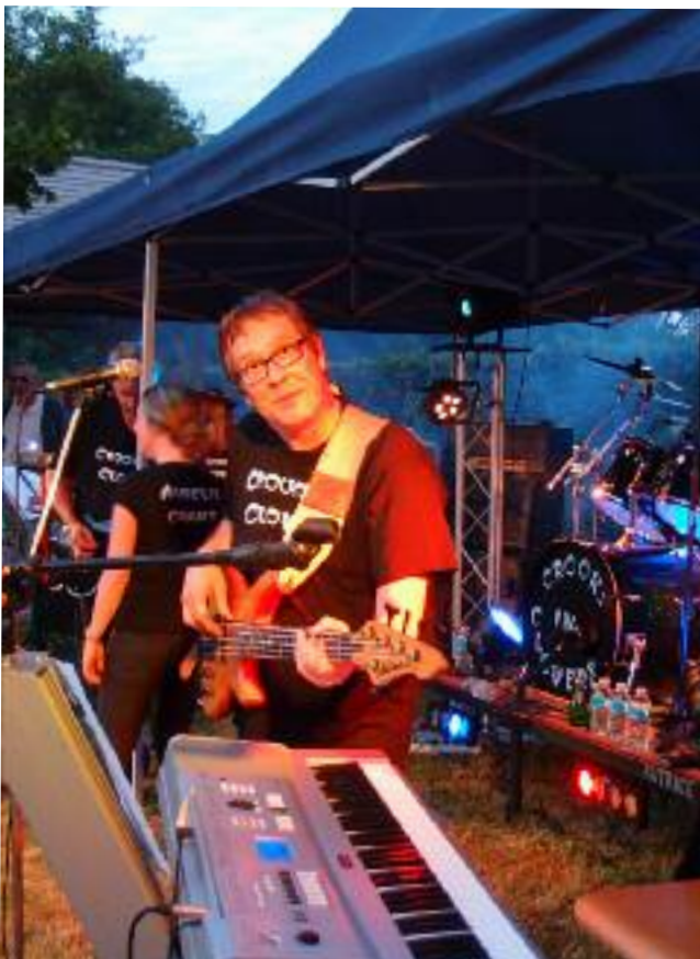
Fête de la Saint-Jean