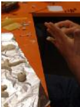
Atelier pâte à sel