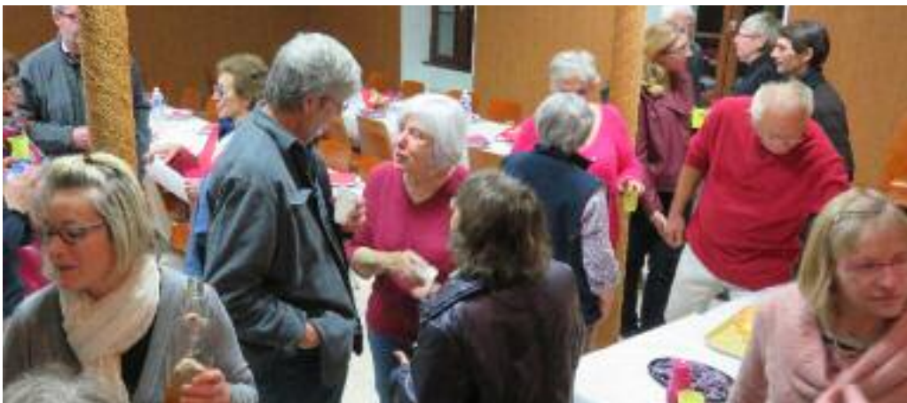
Repas moules-frites pour les chats en détresse