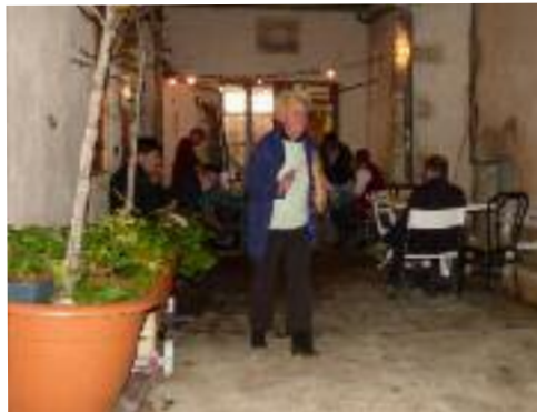
Fête du Fournil