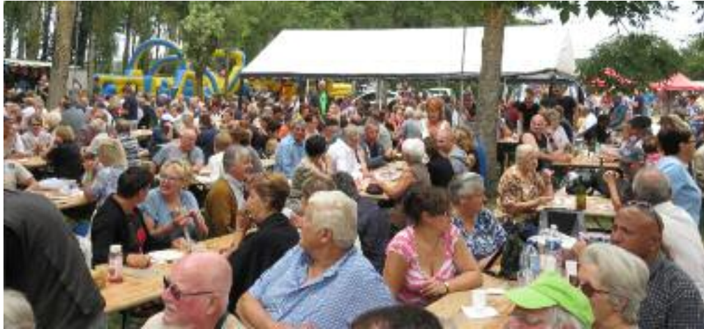
Fête du cochon