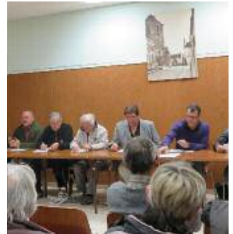
Réunion publique mairie