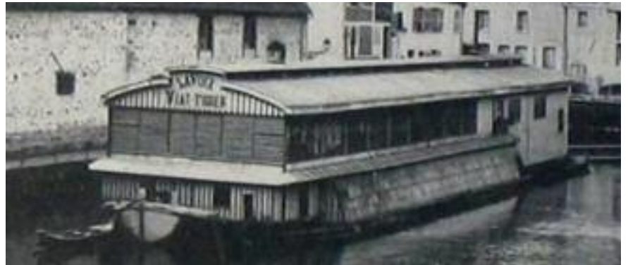
Bateau-lavoir à Nogent-sur-Seine, au début du XX e siècle - (Carte postale ancienne, coll.E.Berthault)