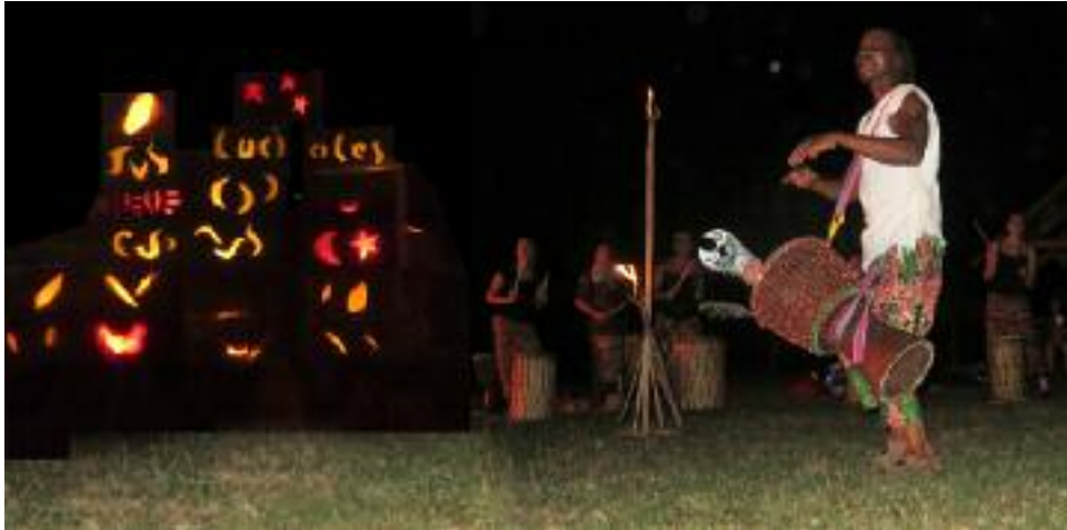
Fête des Lucioles