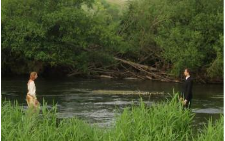
Histoire d'eau - Jérémy Montheau et Roxanne Palazzotto dans l'Yonne - 30 Mai 2015