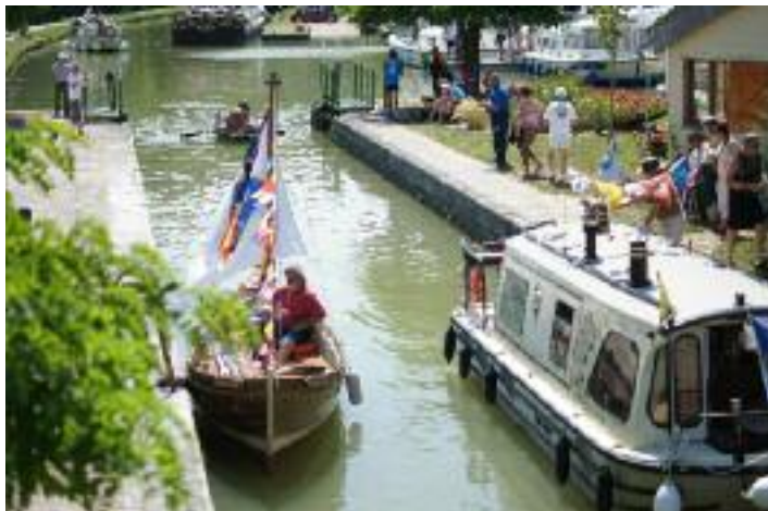
Fête nautique à Châtel Censoir - Juillet 2013