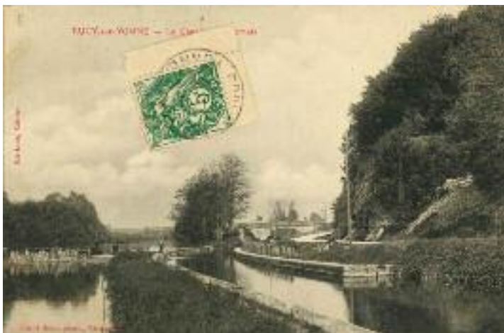
perspective du pont de Bèze vers 1930