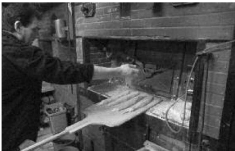
Les rendez-vous du fournil - Chaque 1er Samedi du mois sauf Juillet/Août