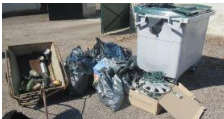
Nettoyage de Printemps - Les Lucioles