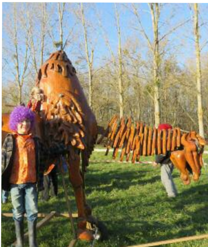
Carnaval des Lucioles et le dromadaire de Rainette