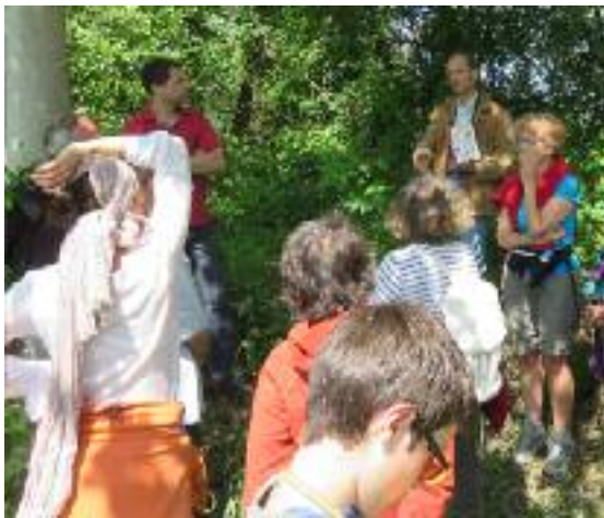
Balade ornithologique Les Lucioles - Mai 2015