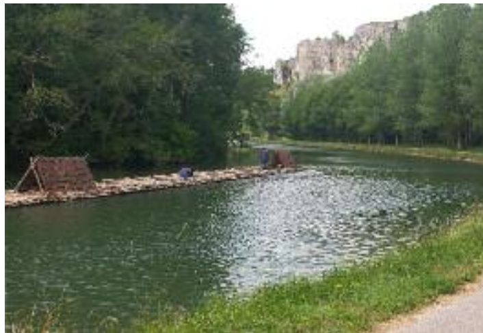
Train de bois - Juin 2015 - Bois du parc

Le Syndicat mixte d'équipement touristique et environnemental du canal du Nivernais et de la rivière Yonne (SMETE, créé en 2004) est basé à Coulanges sur Yonne. Il regroupe des élus du département et des communes que le canal traverse. Il a la charge du développement touristique et économique de la voie d'eau, en mettant en relation porteurs de projets et collectivités locales. Le conseil départemental le finance en partie chaque année par une convention. L'autre partie du financement est apportée par les autres collectivités adhérentes.