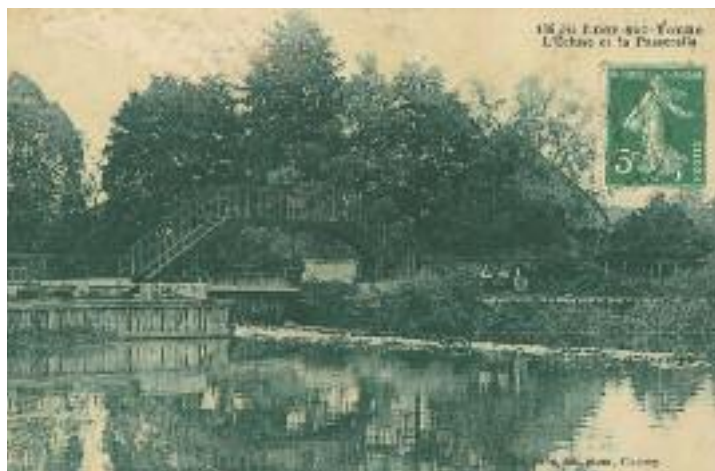
Le Perthuis de Lucy vers 1920 - C.P - Editions Satin - Clamecy

"train de bois" assemblé à Châtel-Censoir, emporté par le courant de l'Yonne et de la Seine, arrive à Paris le 20 avril 1547. Un premier train part de Clamecy en 1549. On estime que par l'Yonne transitait 75% du total du bois flotté, le restant passant par la Cure et le Beuvron.