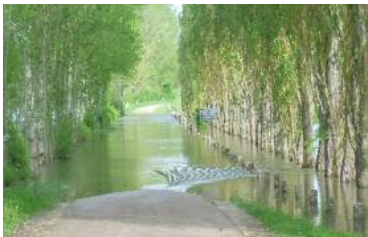
Le "bouillon de Mai" - 2015 - Site de l'Ile