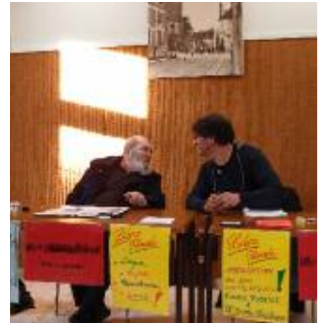
Conférence Libre pensée Lucytoyens