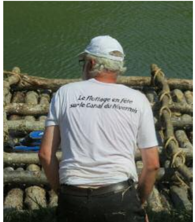
Passage du train de bois à Lucy - Juin 2015