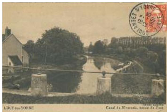
Le pont de Lucy vers 1950

La construction du canal à Lucy sur Yonne a été réalisée entre 1826 à 1830, pour une longueur totale de 3,5 kms. Deux écluses y sont présentes : en venant de Coulanges, celle de Bèze, soit la n°54, et celle de Lucy, la n°55 (qui comme son nom ne l'indique pas est sur la commune de Lichères sur Yonne). Alors que le pertuis de Crain-Bèze se situe sur la commune de Lucy ! Le pont sur le canal a été construit en bois en 1830 puis refait entièrement en 1880. Le pont de Bèze date quant à lui de 1846. Longtemps, les péniches étaient tractées par la force humaine depuis le chemin de halage, puis par des animaux (ânes, mulets, chevaux).